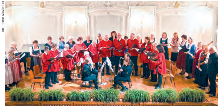
Der Gemischte Chor Alpenklang Hall freut sich über ein gelungenes Konzert.