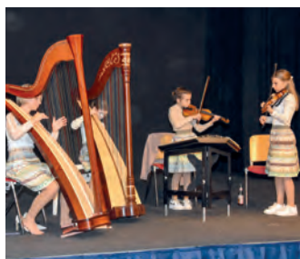
Die jungen Künstlerinnen der Musikschule der Stadt Hall begeisterten.