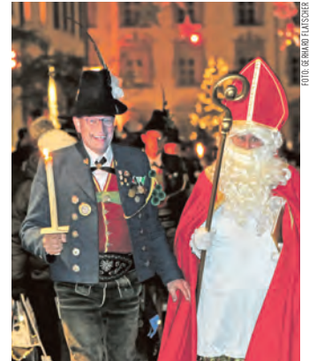
Der Nikolaus geht zu Fuß durch die Stadt, damit er vielen Kindern ganz nahe sein kann.

Zu Fuß geht er durch die Stadt, damit er den vielen Kindern ganz nahe sein kann. Den Weg leuchten ihm die Laternen der Kinder und die Speckbacher Schützenkompanie mit Fackeln. Über die Schulgasse, Agramsgasse, Krippgasse und Bachlechnerstraße, den Oberen Stadtplatz und die Eugenstrasse wird der heilige Mann zum Stiftsplatz wandern. Hier wird er