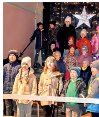
Der Kinderchor der Musikschule der Stadt Hall begleitete die Eröffnung.

Bei der Stadtgemeinde Hall in Tirol gelangt eine Vollzeitstelle (40 Wochenstunden)