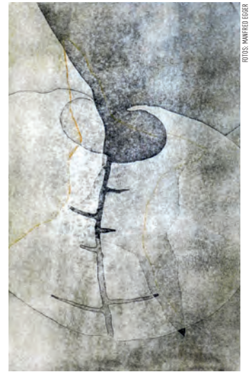
Szecklerland, Momentum – Woodblock

Die TKO Mini-print zeigt die ausgewählten Arbeiten über einen Zeitraum von mehreren Monaten verteilt in drei renommierten Galerien