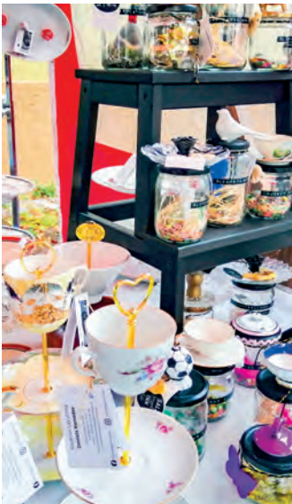
Altem eine zweite Chance geben.