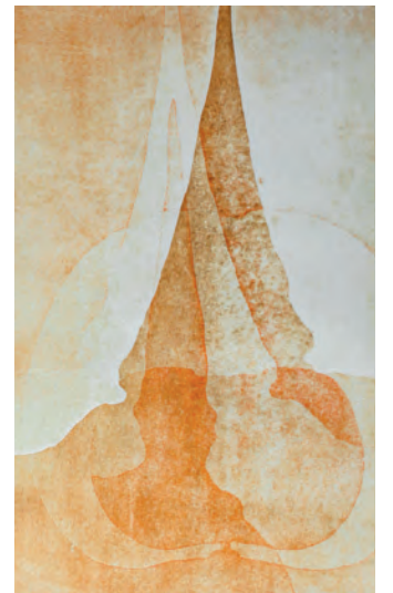
Rzeszow, Lifelines – Holzdruck.