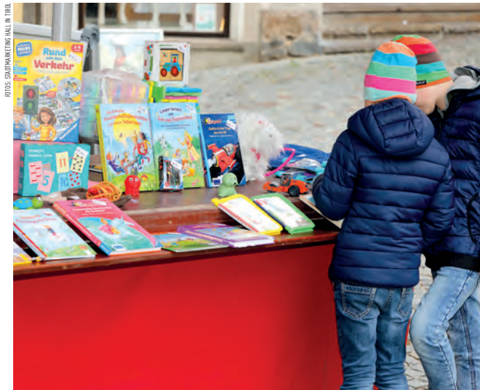
Kinder haben am Flohmarkt die Gelegenheit, Verkaufen und Kaufen zu üben.