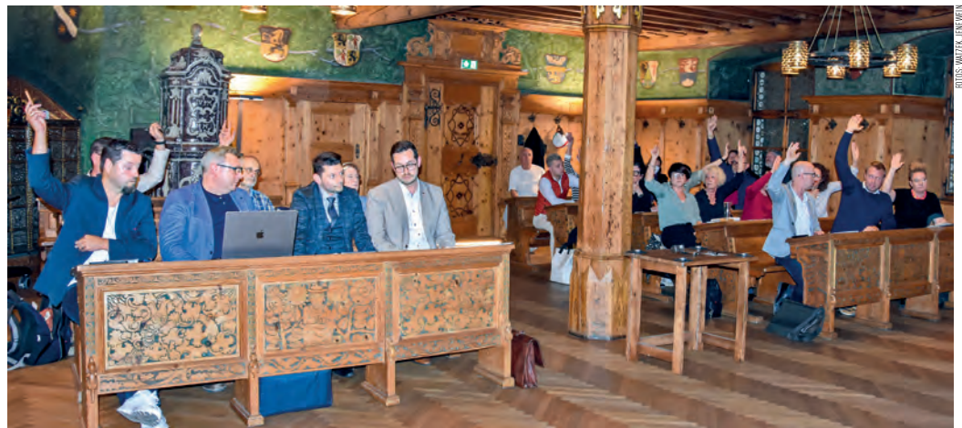
Bei der Sondersitzung des Haller Gemeinderates stimmten 16 MandatarInnen für den Austritt, fünf für ein Bleiben.

2. Der Austritt erfolgte aber auch deshalb, um eine Überwälzung der Schulden der GemNova auf unsere Stadt zu verhindern. Die Stadt