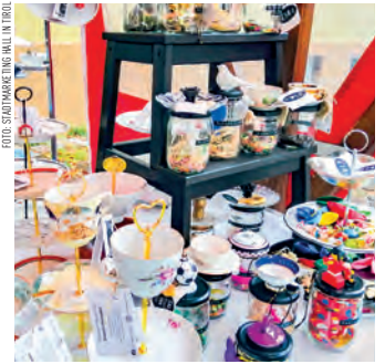
Neben Kleidung gibt es noch allerdhand mehr zu entdecken.