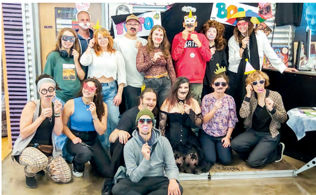
Beim Gruppenfoto durfte der Spaß nicht fehlen. Denn am Weltmädchentag wurde gemeinsam viel gescherzt und gelacht.