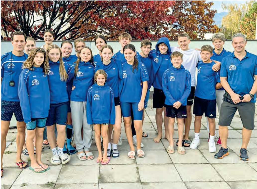
Halls SchwimmerInnen erschwammen in diversen Altersklassen großartige Ergebnisse auf internationalem Niveau.

Starke Leistungen der SU citynet Hall beim 19. Internationalen Alpenmeeting und in Villach.