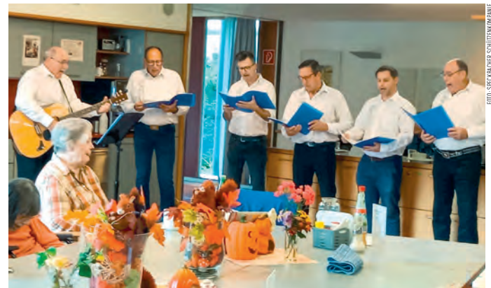
Die Sängerrunde der Speckbacher Schützenkompanie durfte kürzlich die BewohnerInnen des Städtischen Heimes im Seidnergarten mit Liedern und einem kurzen Vortrag von Sagen erfreuen. Ein Austausch, der Sängern und BewohnerInnen gleichermaßen viel Freude bereitete.

Mit Gesang und Unterhaltung den Alltag in Gesellschaft versüßt.