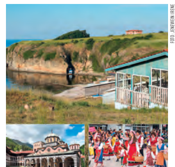
Bulgariens Kultur und Landschaft präsentiert sich äußerst vielfältig.