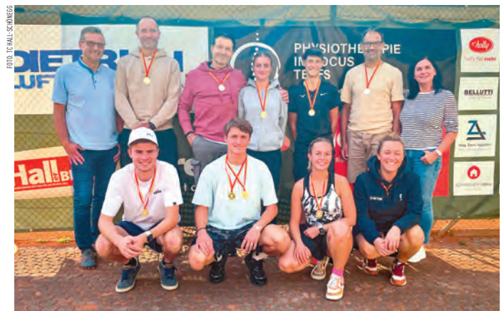
Siegerbild mit den GewinnerInnen der verschiedenen Bewerbe.