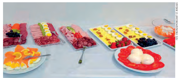
Herzhafte Köstlichkeiten und süße Spezialitäten gemeinsam genießen.

Beim „Vinzenzfrühstück“ steht das Gemeinsame und die Solidarität für in Not geratene Menschen in Hall im Mittelpunkt.