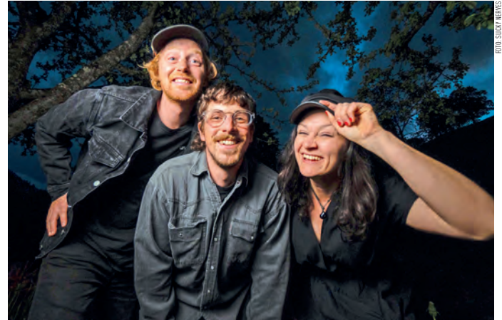
Als Headliner für die Euregio-Konzerttournee sind die Slicky Nerves am Start.

Mehr Information, etwa wer als Vorgruppe auftreten wird, erfahren Sie unter: www.stromboli.at