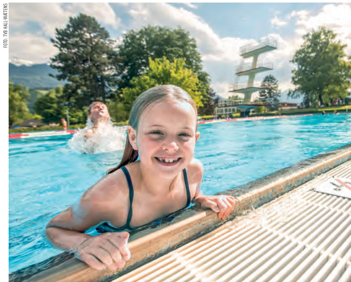
Für heuer endet der Badespaß im Haller Schwimmbad leider.

FREIZEIT. Am 28. Juni begann mit einem Eröffnungsfest ein neues Zeitalter im Haller Schwimmbad. Nach aufwändiger Sanierung konnten die großen und kleinen Badegäste das Schwimmbad in „Besitz“ nehmen und genießen. Trotz kurzer Saison kann recht zufrieden Bilanz gezogen werden: An die 50.000 BesucherInnen erfreuten sich am Bad, an Spitzentagen waren es sogar rund 4.000. Technische Startschwierigkeiten konnten vom Team gut behoben werden. Bis Sonntag, 15. September ist das Schwimmbad noch geöffnet. Anschließend werden bis November noch diverse Wartungsarbeiten durchgeführt, um 2025 im Mai eine neue Schwimmbadsaison starten zu können.