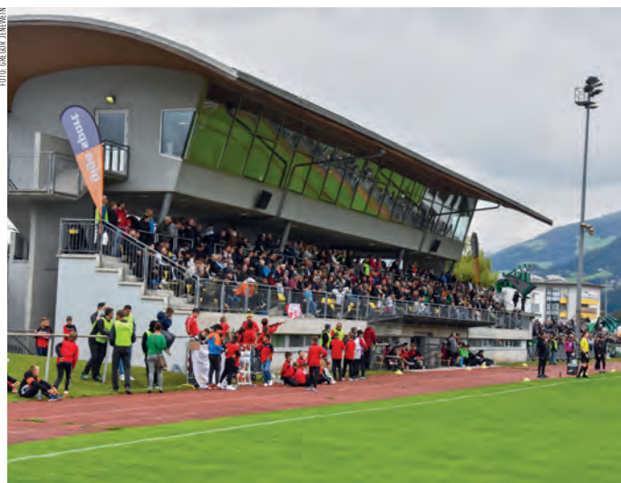
Der Sportplatz Lend wird für unterschiedliche Sportarten genutzt.