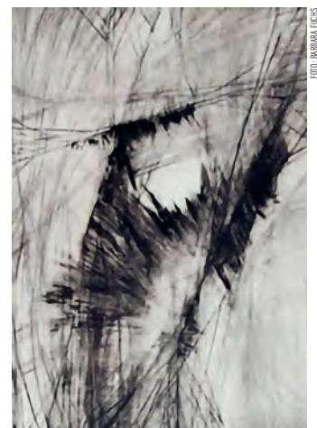
Radierung von Barbara Fuchs.

Mehr Information unter: www.unterdruck.net