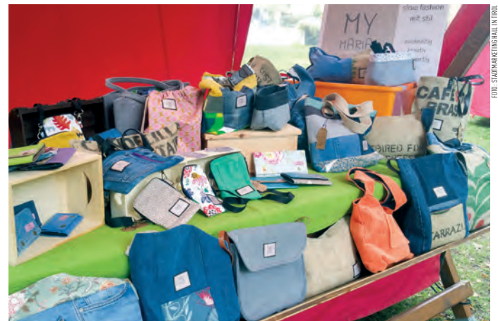
Aus alten Stoffen und Materialien nachhaltig und kreativ Neues entstehen lassen.

Am 14. September in der Bachlechnerstraße von 10 bis 17 Uhr.