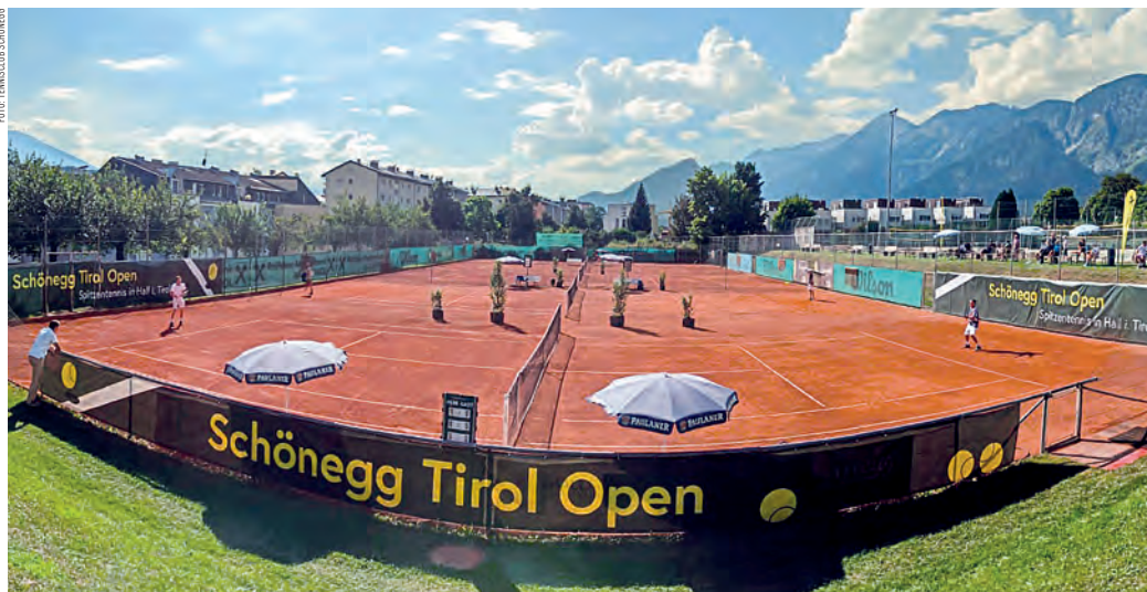
Der Tennisplatz Schönegg war zuletzt erfolgreicher Schauplatz von nationalen Turnieren für Herren und Jugendliche.