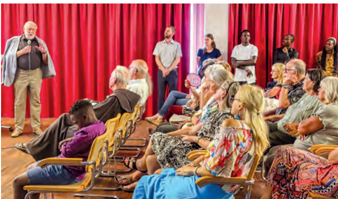
Dr. Franz Fischler sprach über Erfahrungen, Möglichkeiten und Umsetzbares.